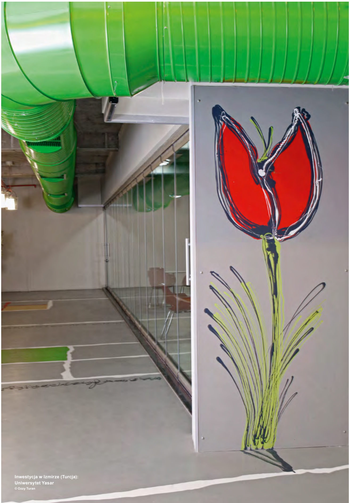
Inwestycja w Izmirze (Turcja): Uniwersytet Yasar