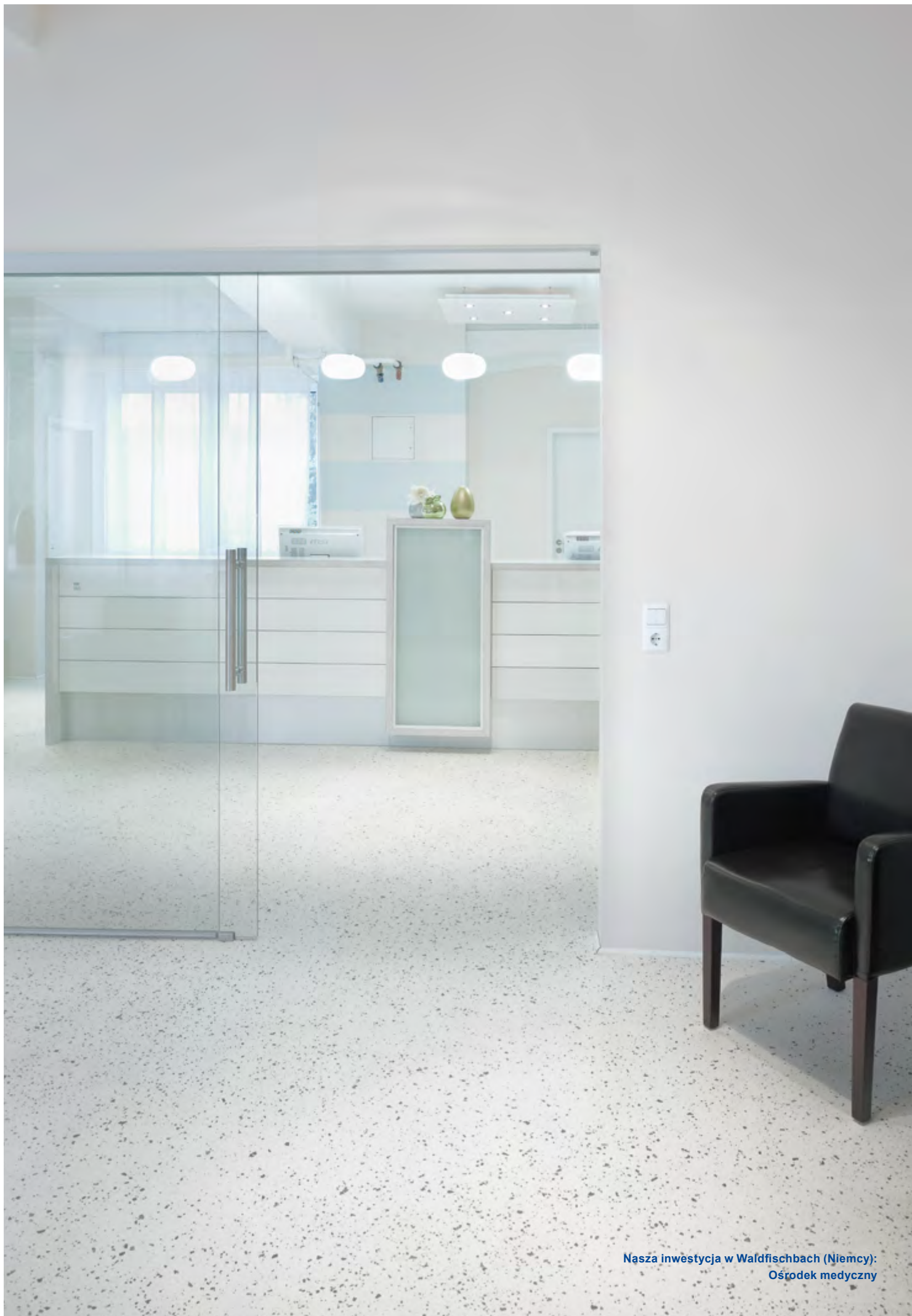
Nasza inwestycja w Waldfischbach (Niemcy): Ośrodek medyczny