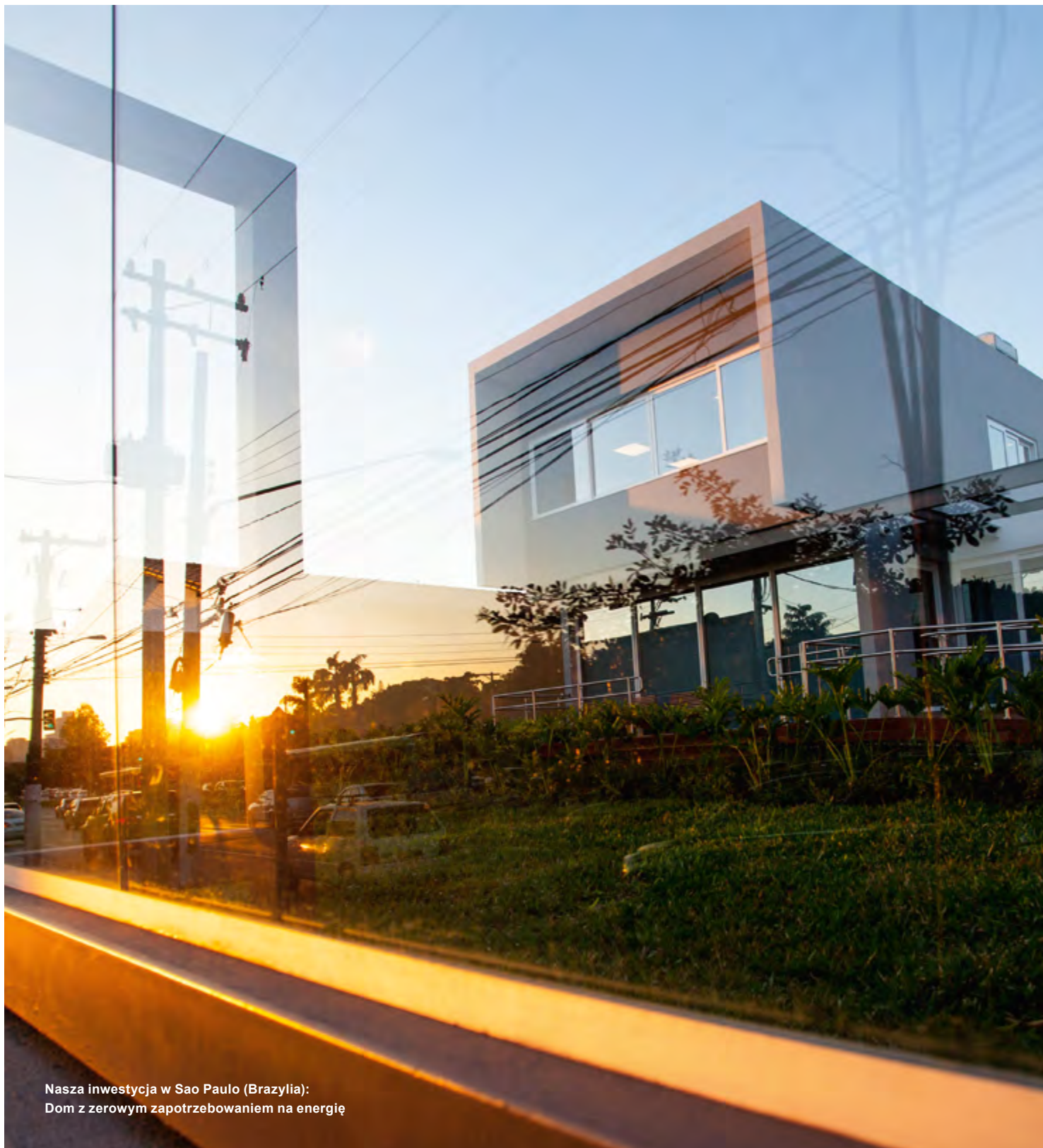
Nasza inwestycja w Sao Paulo (Brazylia): Dom z zerowym zapotrzebowaniem na energię